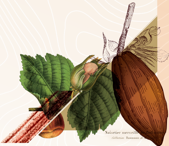
Noisetier merveilleux... Collection Baumann...